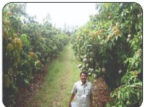
दक्षिण आफ्रिकामधील फळांनी लगडलेली अतिघन आंबा लागवड