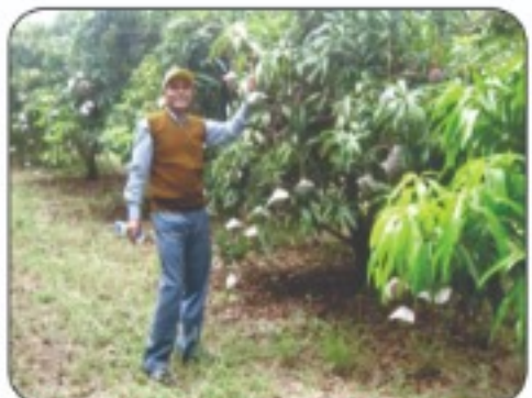
दक्षिण आफ्रिकामधील अतिघन लागवड बागेत फळाला कॅपिंग केलेले