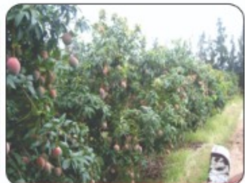
दक्षिण आफ्रिकामधील फळांनी लगडलेली अतिघन आंबा लागवड